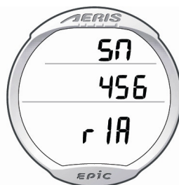
Seriennummer & Firmware Version

So können Sie die Seriennummer ablesen: Halten Sie den M-Knopf (oben links) für 2 Sekunden gedrückt um in den NORM - Oberflächen Modus zu gelangen, dann drücken Sie bitte den A- ( unten links) und den S- (oben rechts) Knopf gleichzeitig 4 mal ( für jeweils 2 Sekunden)